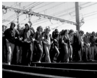
Il s'agit de ne pas se rendre