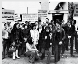
Un simple exemple