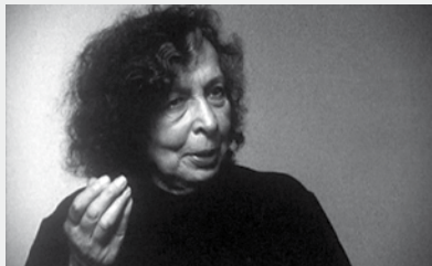
La Véritable histoire d'Artaud le Môme

La rencontre avec Antonin Artaud, de retour à Paris en mai 1946, est une illumination pour Jacques Prevel. Dès lors, le jeune poète va suivre Artaud dans ses pérégrinations entre la maison de santé d'Ivry et Saint-Germain-des-Prés, tout en poursuivant la même quête de poésie, de drogue et d'absolu. Devenu le disciple, le pourvoyeur et le compagnon de l'homme de génie, il va s'attacher à tenir la chronique de leur relation jusqu'à la mort d'Antonin Artaud, deux ans plus tard.