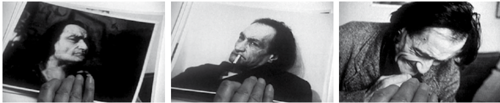
La Véritable histoire d'Artaud le Môme

Gérard Mordillat, artiste engagé, autant par ses prises de position publiques que dans son œuvre, est un homme d'images et de mots, les deux inextricablement liés : romancier, cinéaste et même "jongleur" du verbe ( Les Papoux dans la tête sur France Culture ). À l'occasion d'une projection de son premier film réalisé avec Nicolas Philibert ( La Voix de son maître ) nous avons évoqué ensemble comment une parole, même filmée frontalement, peut produire de vrais moments de cinéma. Quelle mise en scène, quelle mise en condition sont alors nécessaires ? Attention du réalisateur à l'inscription de cette parole dans l'espace filmé, intensité de la relation à la personne qui s'exprime, capacité d'évocation de celle-ci... Est né alors le désir de montrer son travail, en documentaire et en fiction, autour d'Antonin Artaud.